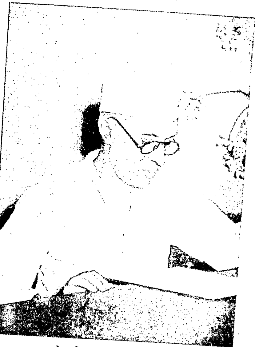
बापू के अहिंसक भक्त—जवाहरलाल नेहरू