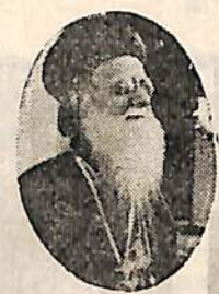
പ. ഗീവർഗീസ് II ബാവ

പുണ്യവാളരുടെ ഉടയവനു സ്തുതി പുണ്യവാളരെപ്രതി അത്ഭുതങ്ങളിലൂടെയും കരുണ ചെയ്യുന്ന കർത്താവിന് സ്തുതി വി. ജൂദാസ് തദേവുസിന്റെ മദ്യസംഗ്രഹങ്ങൾ ഞങ്ങളോട് കനിഞ്ഞ ദൈവത്തിന് സ്തോത്രം ഞങ്ങൾക്കുവേണ്ടി അപേക്ഷിച്ച വി. ജൂദാസിന് കൃതജ്ഞത നിസ്സഹായർക്കുവേണ്ടി പ്രാർത്ഥിക്കുന്ന വി. ജൂദാസിന്റെ പ്രാർത്ഥന ഞങ്ങൾക്കുവേണ്ടി.