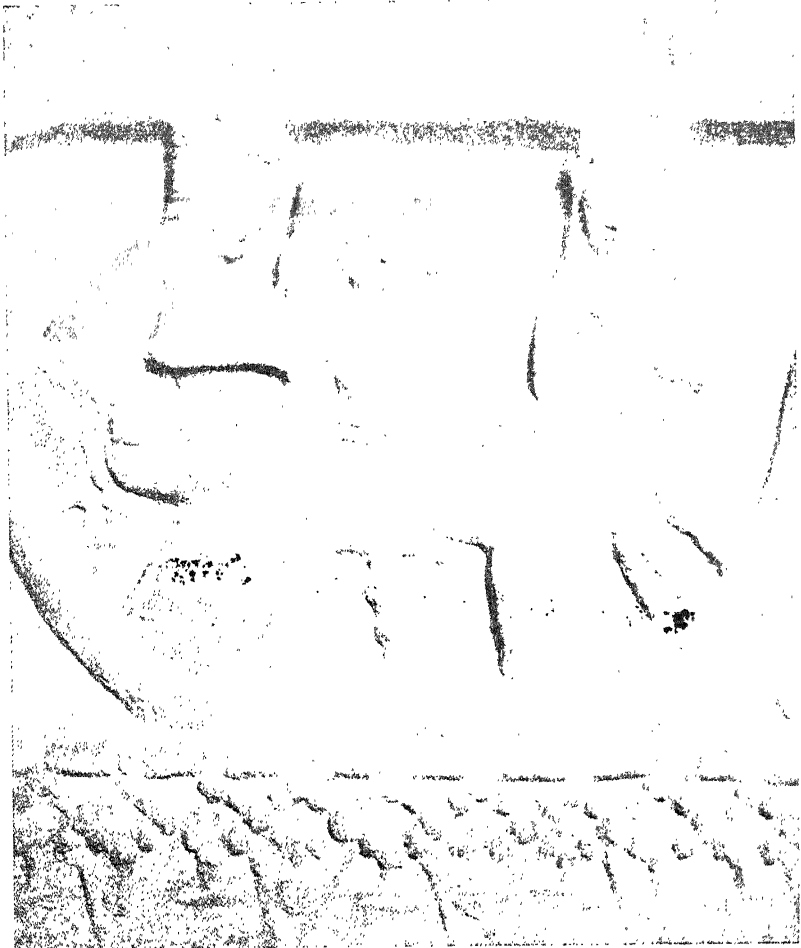
मखादेव जातक (६)